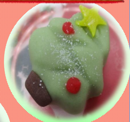
12/24 (金) もみの木まんじゅう