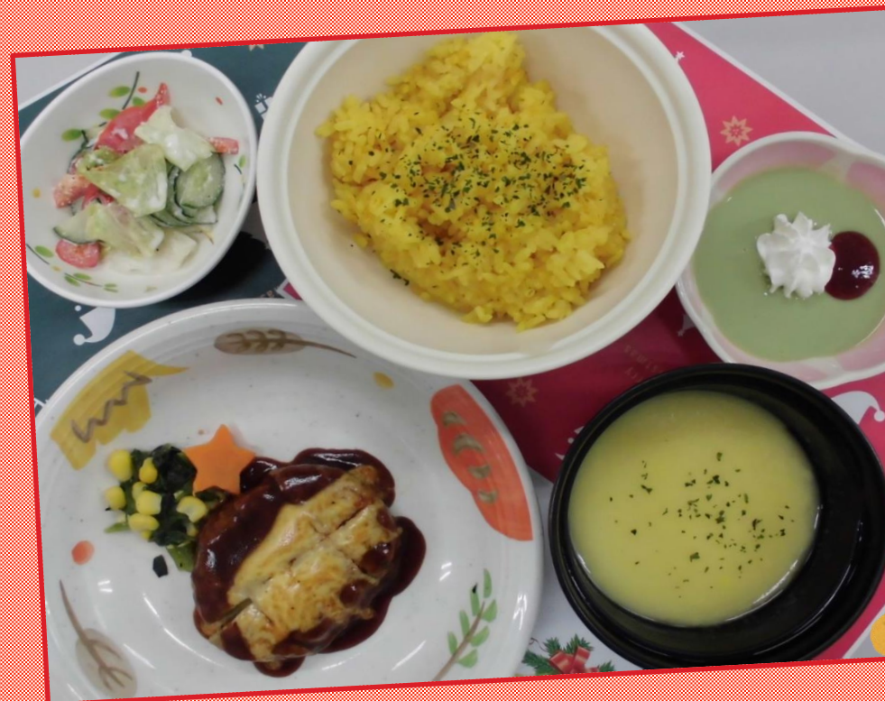
12/16 (木) クリスマスメニュー