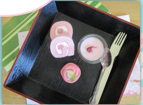
春のおやつ3種盛り