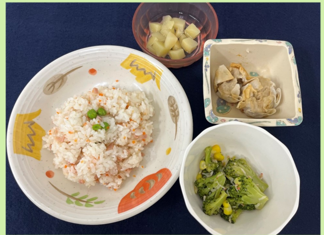
10/23(木) ハムピラフ、シュウマイ ブロッコリーサラダ、モモ缶