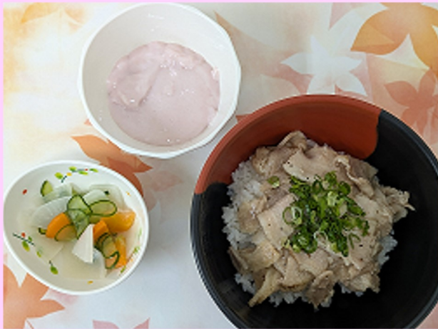
10/10(金) 豚塩カルビ丼、三色浅漬け、フルーチェ

今月は豚塩カルビ丼とハムピラフをご紹介します。 塩だれで炒めた豚肉はさっぱりと食べられます。 ハムピラフはハムとごはんの食感がベストマッチしています。 どちらも利用者さんから「美味しい！」と大変好評でした。